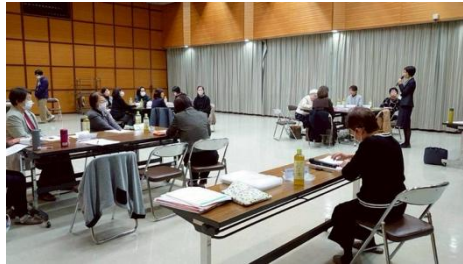
女性リーダーさんから一言