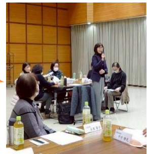
議員さんから一言