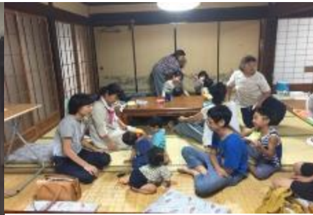
食事のあとは多世代 で遊びタイム