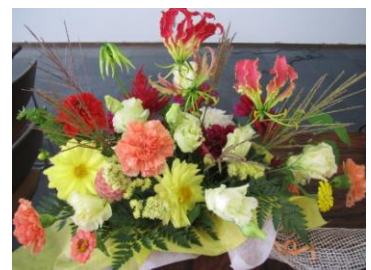
演台を飾った武豊町幹事鈴木 さんのアレンジフラワー

発表者A. 議員さんと身近なお話ができるこのような場所を作ること は大切と思う。回を重ねることが大切だと思う。