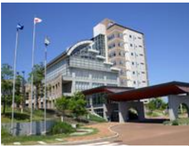
オーシャンビューのフォーラム 会場 JA あいち知多総合本部ビル

2014 年が始まりました。皆さんは、どのようなお正月を過ごされたでしょうか。長期休暇を利用して旅行をされた方や、ご家族とのんびり過ごされた方もいらっしゃるかと思います。私はといえば、お雑煮をほおぼりながら、1 月 26 日(日)に予定しているフォーラムに胸を膨らませていました。