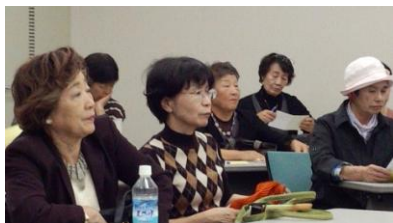
会員とともにDVDを視聴する参加者のみなさん

私が思う男女共同参画…男だから女だからでもなく、人間として平等。役割分担が出来、助け合っている感覚を持ち、お互いを尊重信頼出来る。相手を尊重するという事は、何かあった時にも相談が出来、相手の意見が聴け、自分の意見も言える。