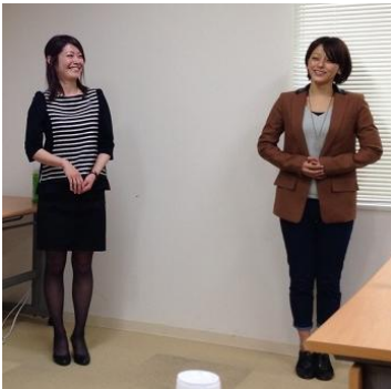
女性デザイナー兼営業部長が活躍する本田プラス(株)