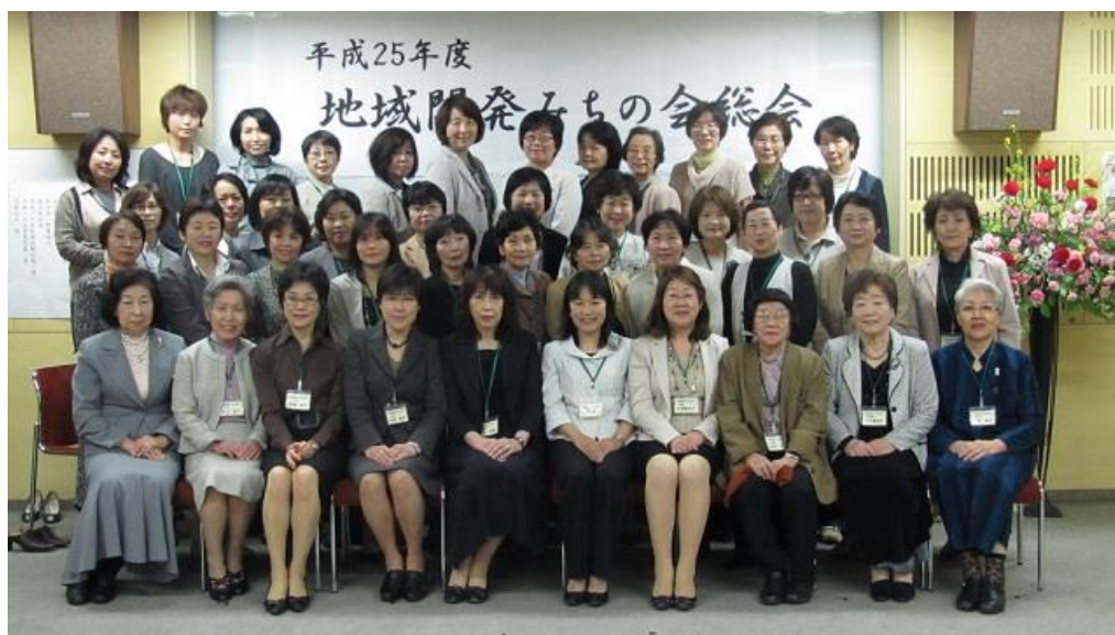
平成 25 年 4 月 25 日 常滑市中央公民館