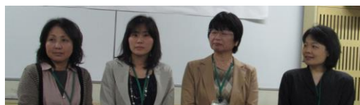
総会に出席した新会員の皆さん