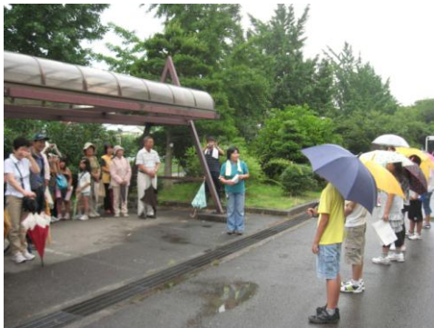
フナビオレンジャー6人の紹介

みちの会 Cブロック(東海市・知多市・常滑市)では、『楽しく学ぶ』を基本に船島小学校の児童(フナビオレンジャー)にビオトープの説明を、ネイチャーゲームをネイチャーゲームリーダーにお願いしました。あいにくの雨の中でしたが、生物多様性について楽しく学ぶことができました。フナビオレンジャーたちが、大人世代や同世代の参加者にしっかりと説明をし、きびきびと案内する様子にはとても感心させられました。