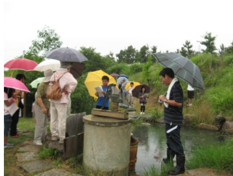
ビオトープ 井戸の説明