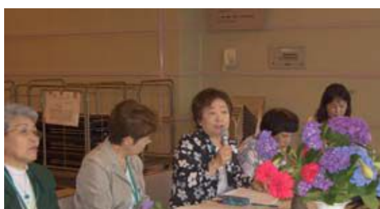
梅雨によく似合う紫陽花の飾られたテーブルを囲み 20 年の思い出話に花が咲きました。

日時：6 月 15 日（木）10：00～14：00 場所：東海市商工センター・1F 多目的ホール 参加者：歴代会長 12 人 役員・幹事 8 人